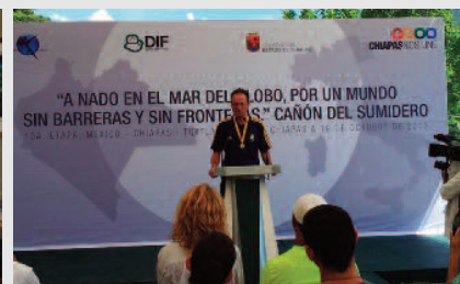
Chiapas - Sumidero Canyon Messico