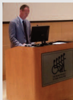
Miami Project, auditorium Lois Pope