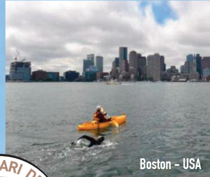
Boston - USA