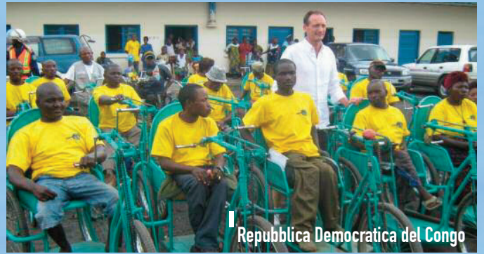
Repubblica Democratica del Congo