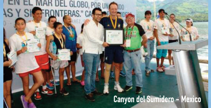
Canyon del Sumidero - Mexico