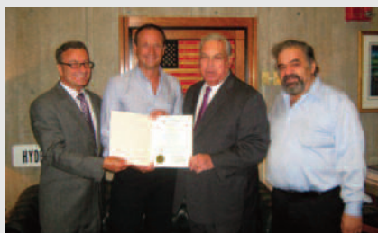
Attestato di riconoscenza conferito dalla città di Boston