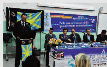
Torre Annunziata, Liceo Pitagora-Croce