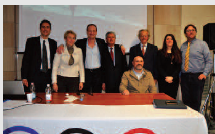
Salone d'Onore del CONI - Genova Sport, Tecnologie e Politiche sulla Disabilità