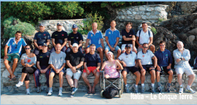
Italia - Le Cinque Terre